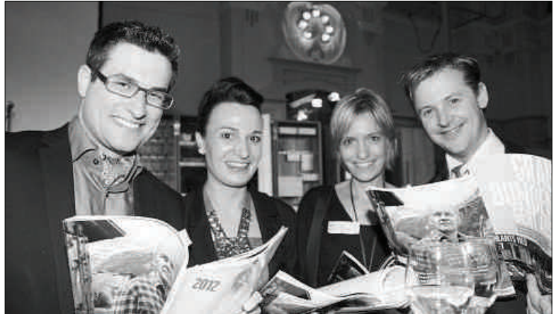
Ustieras ed ustiers en contents cun la nova ediziun dal magazin per gourmets.