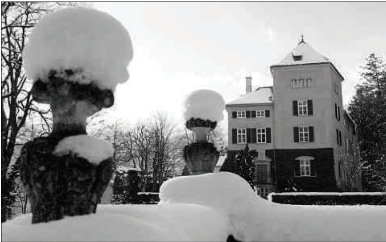
Tar ils tempels per gourmets è quai il «Schauenstein» Fürstenau.